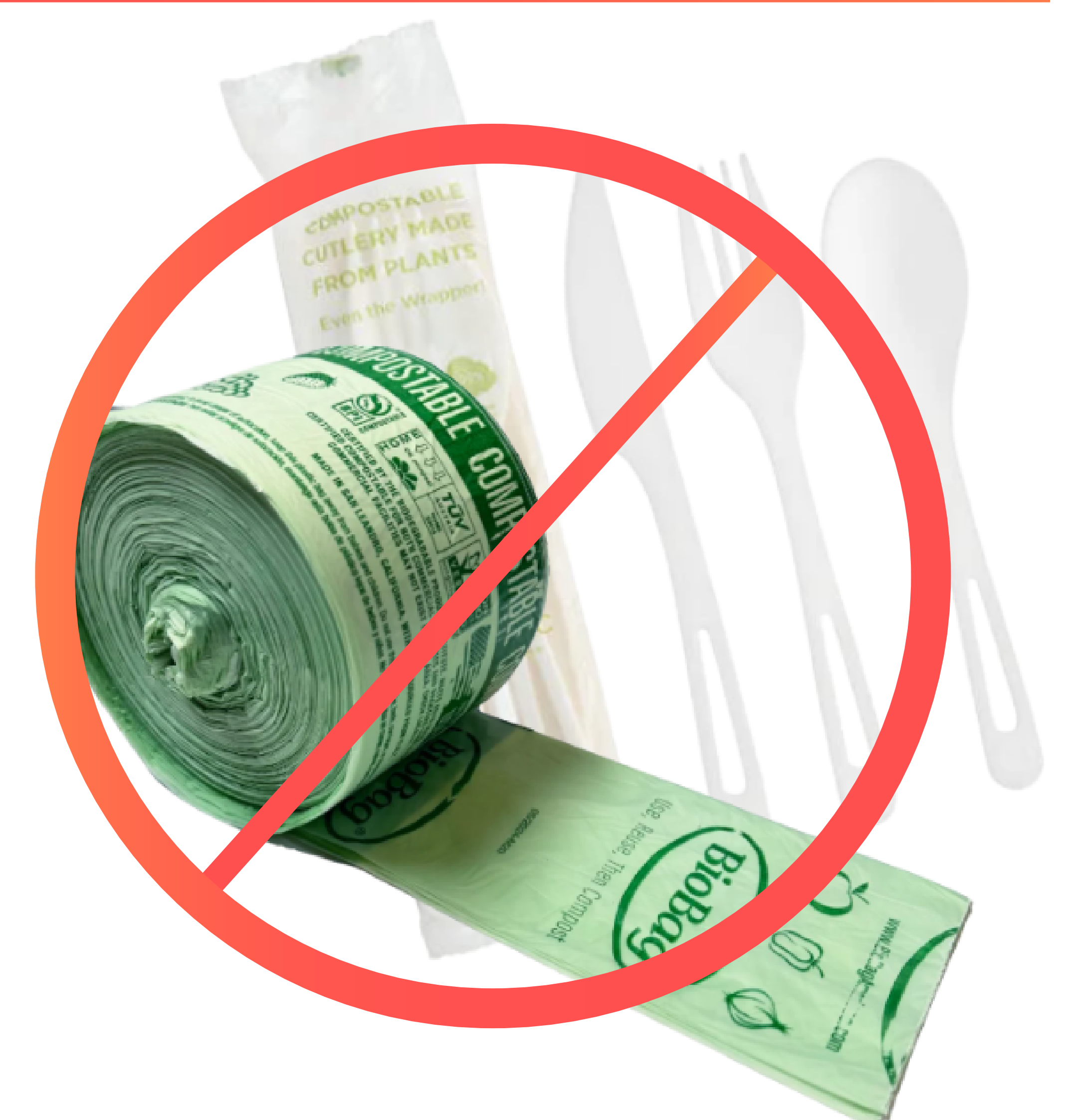
Synthetic plastics labeled "compostable", "biodegradable", or "plant-made" (#7)