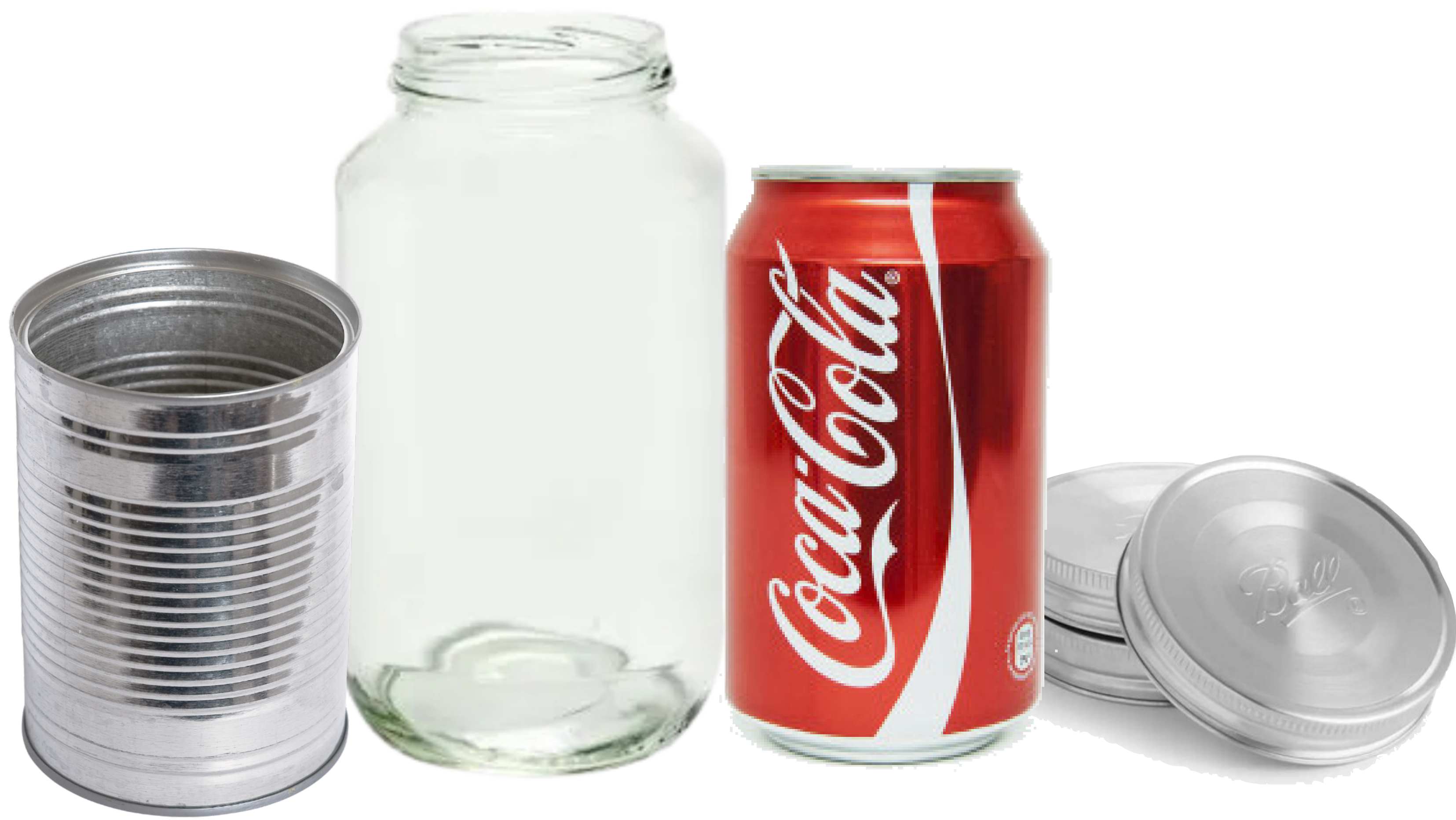
Productos de vidrio, estaño, acero y aluminio que están limpios y vacíos