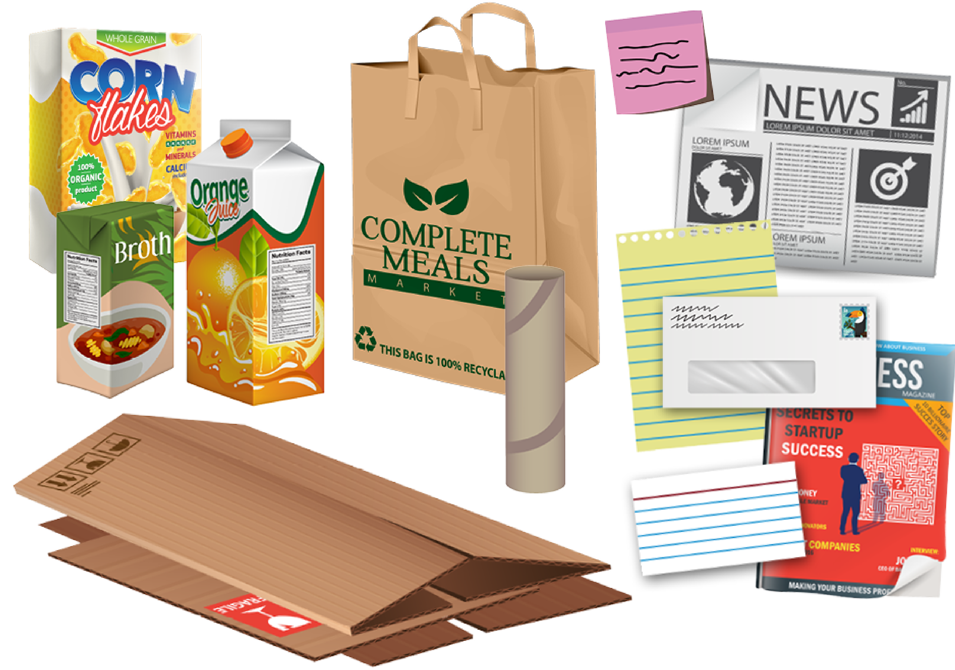
Productos de papel y cartón

Productos plásticos que están limpios y vacíos con número: