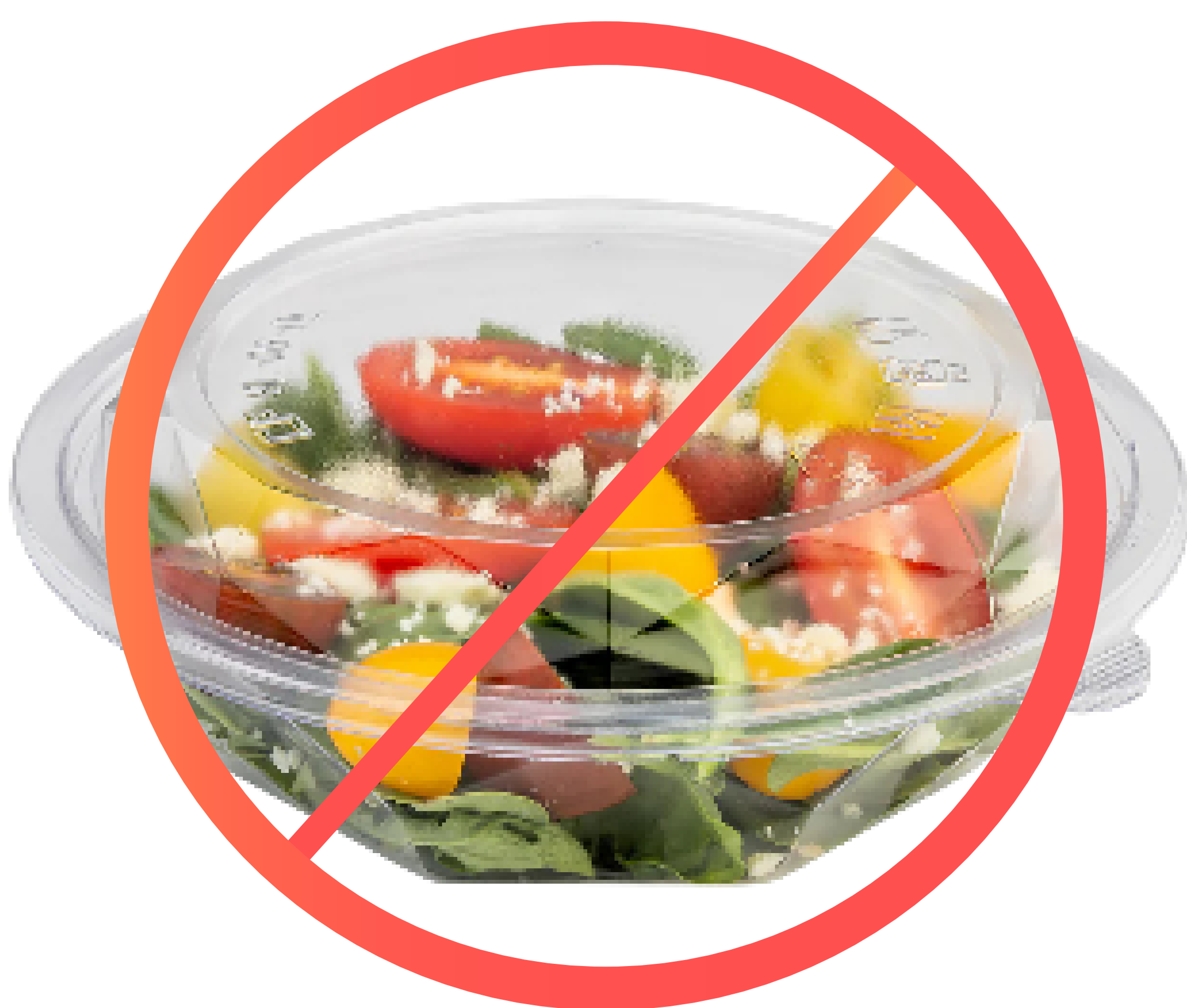
Food-soiled containers, unwashed plastics with food scraps or food residue