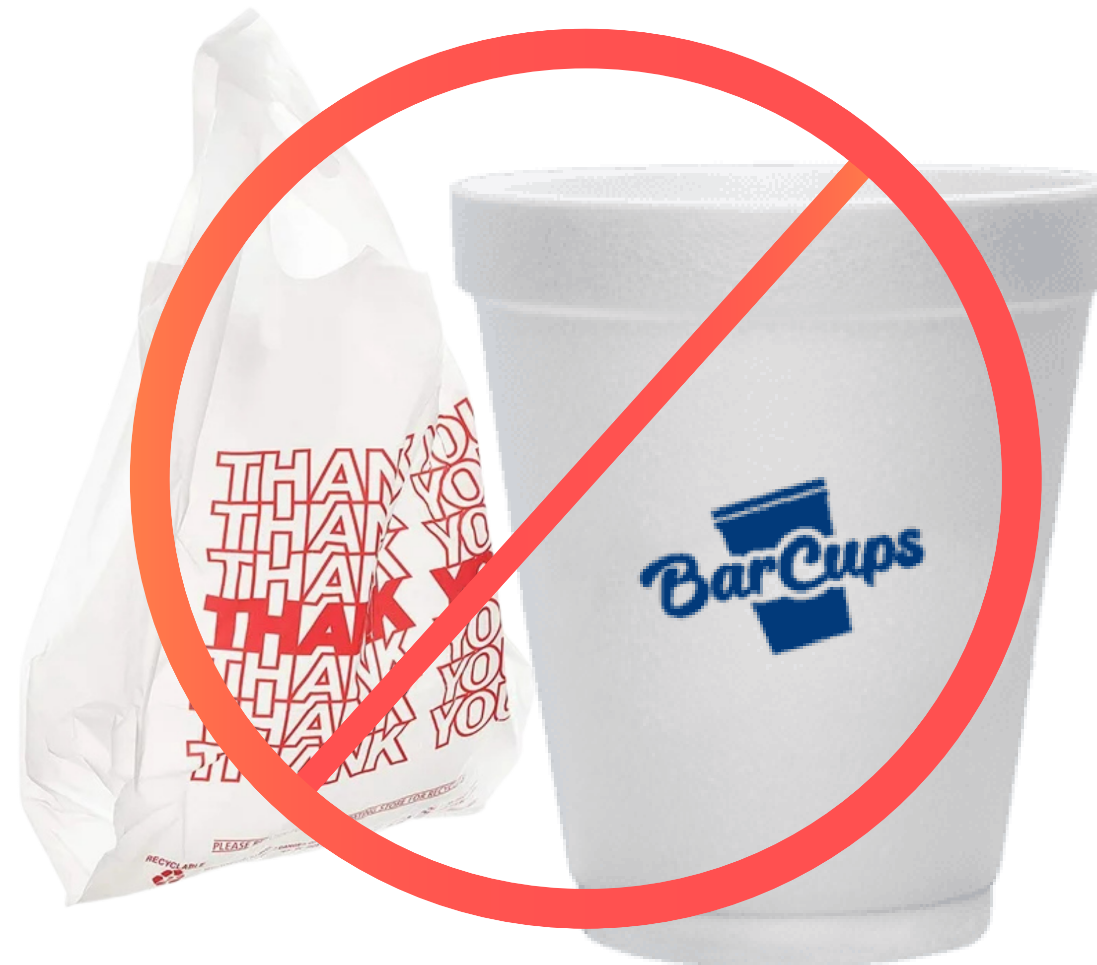
Plásticos con número #3, #4, #6, y #7